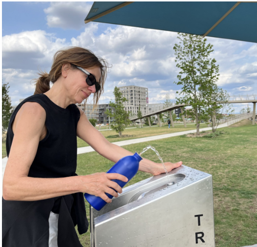
Beispiel: https://trinkbrunnen-kalkmann.de jeweils zum direkten Trinken oder Auffüllen der eigenen Trinkflaschen.