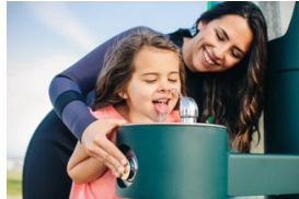
Beispiel: https://www.aquadona.com/referenzen >> hier auch für Hunde